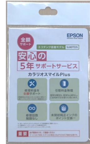
カラリオスマイルPlus