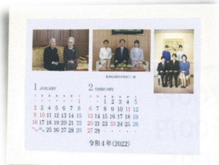
③ 卓上式カレンダー