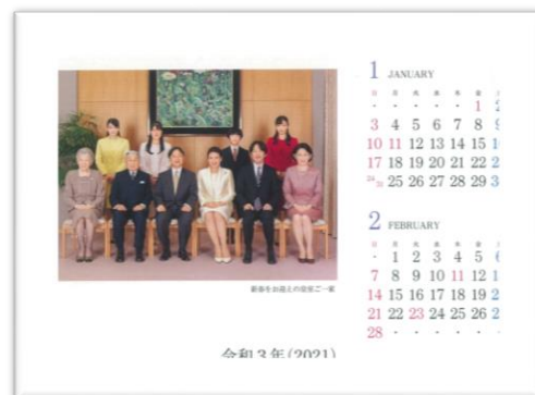
③ 卓上式カレンダー